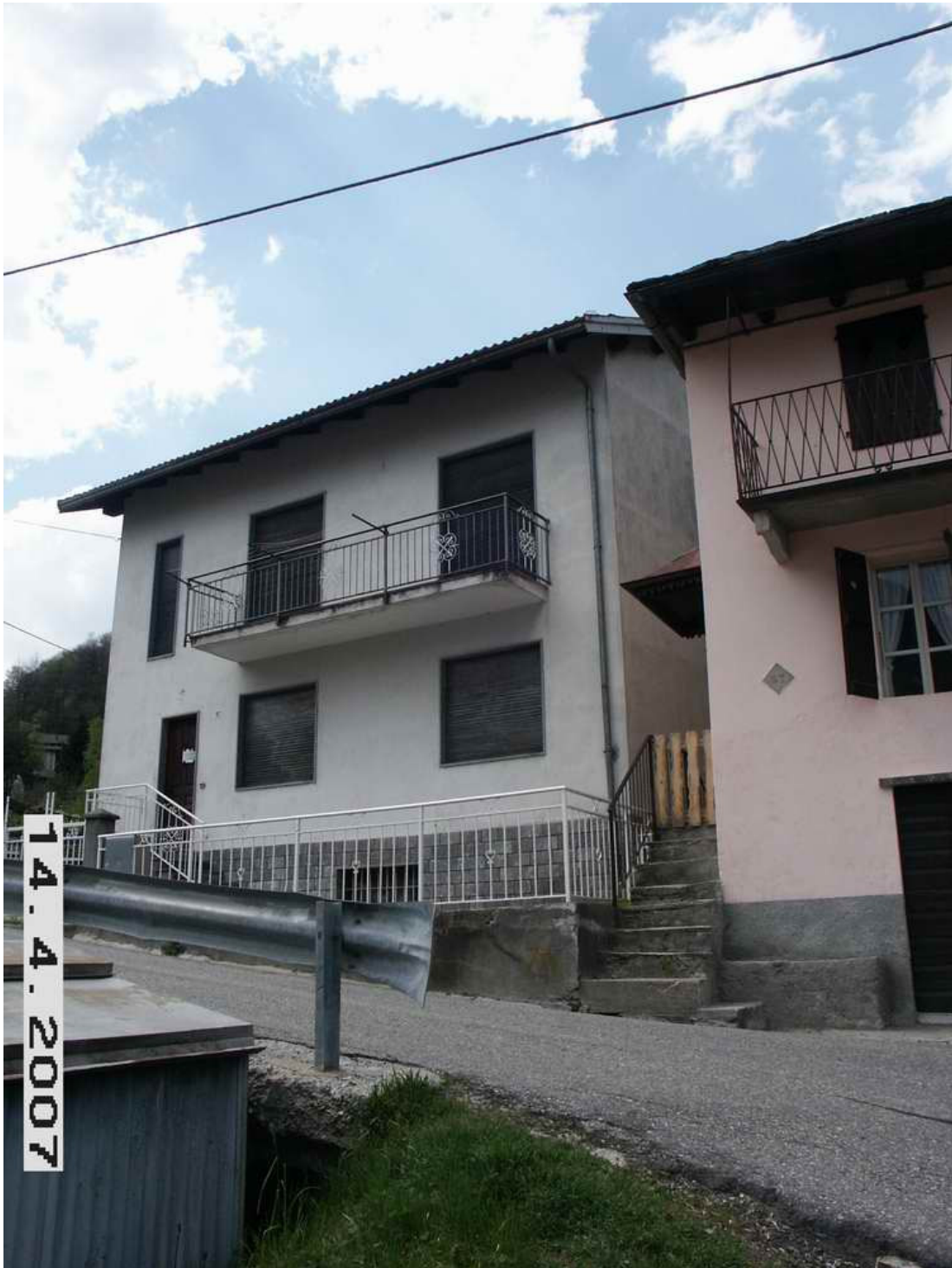
Comune di Calasca Castiglione - Località Vigno - Casa