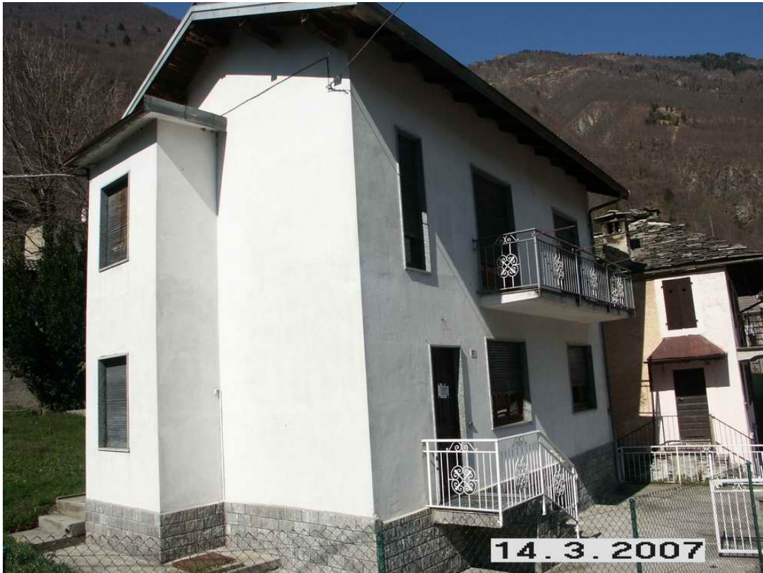
Comune di Calasca Castiglione - Località Vigino – Casa