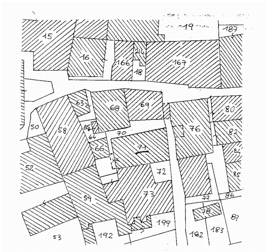
Comune di Villadossola – Foglio 32 Mappale 71 sub 2