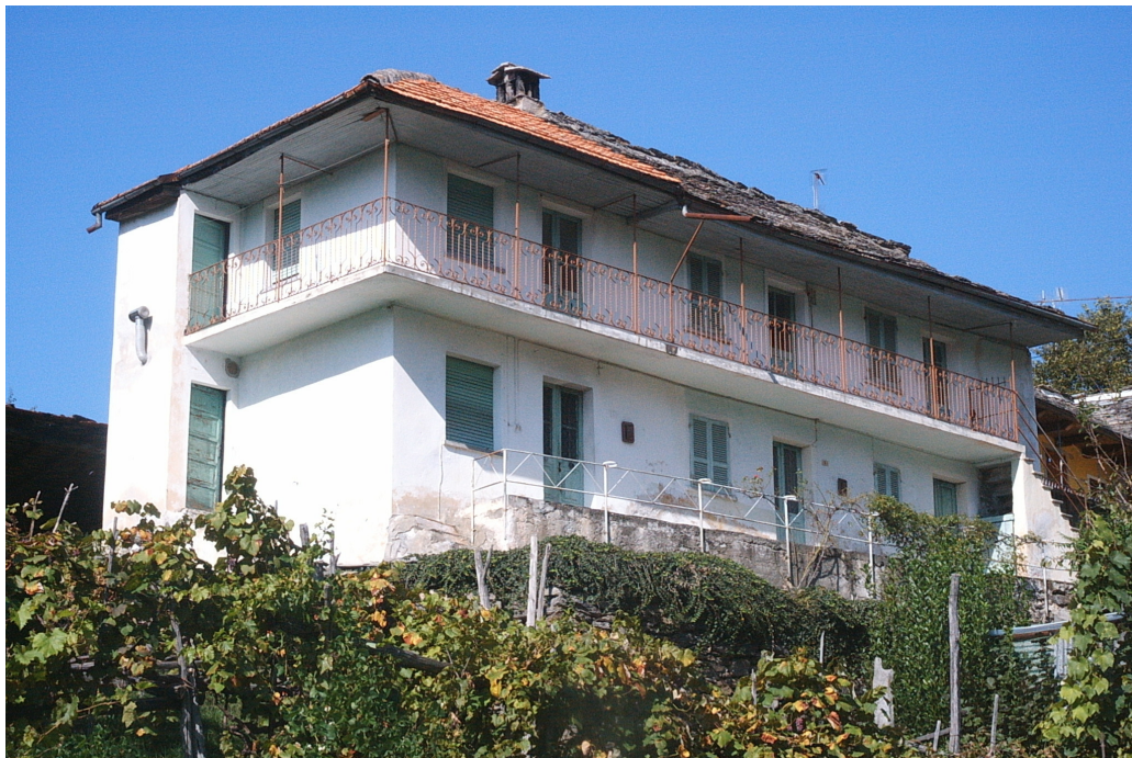
Fotografia n. 2 del fabbricato