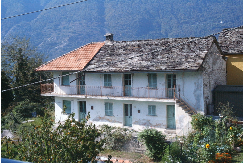
Fotografia n. 1 del fabbricato